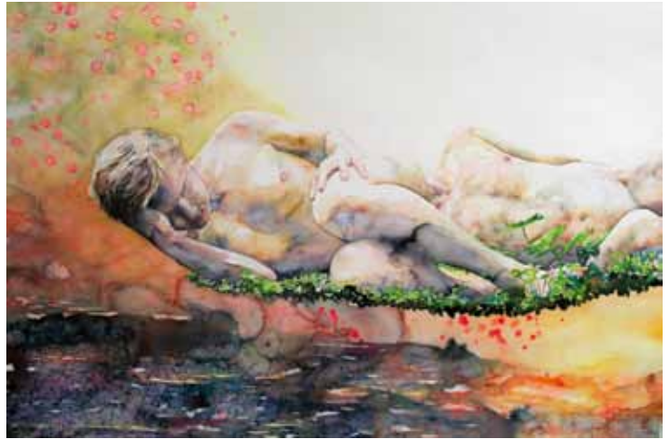
Inexhaustible Beauty – Flesh for Fantasy , 120x180 cm, 2011

En bild, låt oss säga ett porträtt, är en paus mellan osäkra antaganden. Ett porträtt blir aldrig fullständigt. Ett porträtt kommer aldrig att visa hela människan utan endast våra uppfattningar av varandra. I en mängd avbilder ser man till slut bara konstnärskapet och inte människorna som står framför målarens öga.