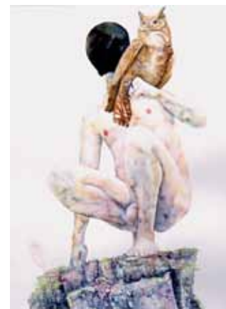
Inexhaustible Beauty –Anthonys Dream, 120x180, 2009 & The Garden 1 og 2, 120x90cm x2, 2011

svårt att ta sig fram när hon gick ut skolan. Marianne Darlén Solhaugstrand lärde sig att försvara sina projekt idémässigt och förklara varför hon ville måla i akvarell. När hon sedan gick ut Kunsthøgskolen så svängde plötsligt trenden inom konsten och akvarell blev mera uppskattat. Hon kom med på flera grupputställningar och blev framlyft i media.