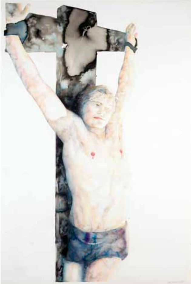
Inexhaustible Beauty – The Blood of Christ is Milk , 180x120 cm, 2011

Hon valde också att måla i akvarell istället för olja därför att akvarellen mer sägs vara en kvinnornas och amatörernas tradition. Oljemåleriet har hela konsthistorien i ryggen och i och med att hon valde akvarellen så ställde hon sig i högre grad vid sidan av konsthistorien. Hon behövde inte kommentera den långa traditionen av oljemåleri utan kunde koncentrera sig på bilderna och själva berättandet. På samma sätt som oljemåleriet är tyngt av konsthistoriska referenser så bär det även med sig konnotationer till tidigare konstnärer